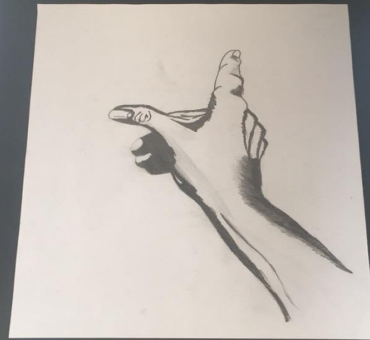
BERNA DEMİR (B/A)